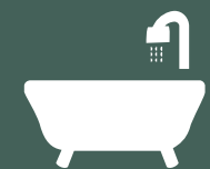
حمام متعدد الاستخدام