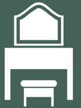
غرفة نوم رئيسية